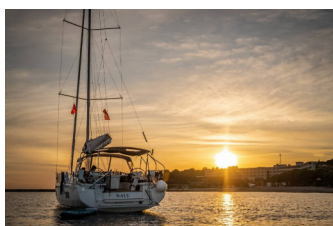
OCEANIS 46.1 - layout 4 CABINS & 2 HEADS